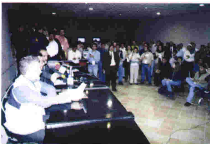
En conferencia de prensa los Consejeros Electorales reportan los primeros resultados preliminares

El PREP fue instrumentado a partir del objetivo de difundir de manera inmediata en la sala de sesiones del Consejo General, y ante los partidos políticos, ciudadanía y medios de comunicación, los resultados preliminares de las elecciones para la renovación de la Legislatura y los 57 Ayuntamientos de la entidad.