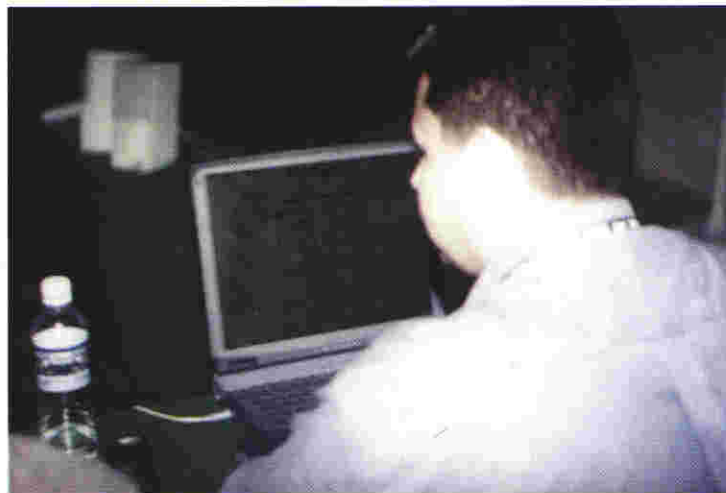
El sistema PREP del Proceso Electoral 2001, fue desarrollado completamente por personal calificado del IEEZ

Siempre bajo la premisa de la transparencia y certidumbre del proceso, así como de fluidez de la difusión de los resultados electorales, el Consejo General acordó que la información de cada una de las 2,212 casillas se diera a conocer, de modo simultáneo al momento de su captura, en la sala de sesiones del Consejo General, sin esperar, como fue el caso en otras entidades, a un acumulado. Para proyectar los datos en las pantallas gigantes se diseñó un sistema de carrusel que cada once segundos circulaba y actualizaba el resultado de cada uno de los 18 distritos y los 57 municipios.