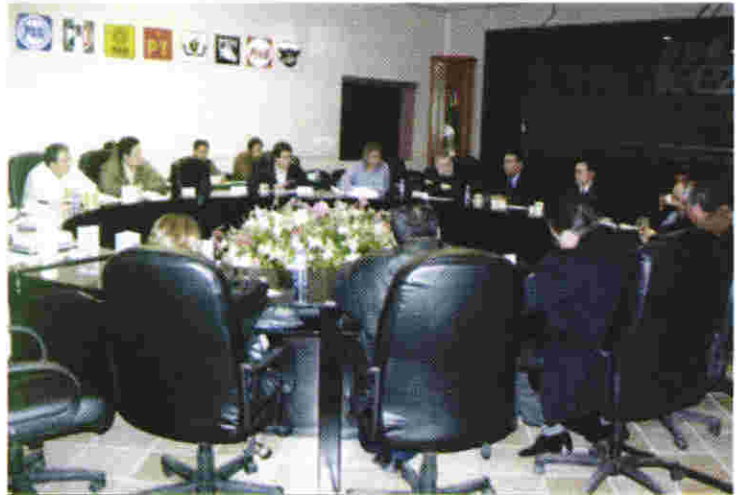
El Consejo General se instaló en Sesión Permanente para dar seguimiento a la Jornada Electoral

Todo el trabajo que ha realizado el Instituto Electoral -concluyó el Consejero Presidente- persigue una sola finalidad: que el voto de los ciudadanos determine quienes ejercerán los cargos de gobierno y de representación. Hasta ahora, dijo, hemos cumplido nuestra parte, conmino por ello a la ciudadanía para que acuda a las urnas a depositar su voto. Solicito a las autoridades de los tres niveles de gobierno que garanticen un ambiente de seguridad y vigilancia del proceso electoral; en el marco del derecho, convoque a las dirigencias partidistas a continuar privilegiando el diálogo como