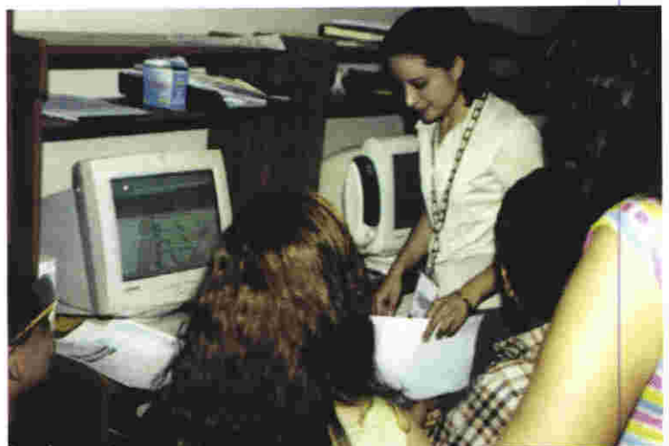
El Programa de Resultado Electorales Preliminares (PREP) fue diseñado y operado en su 100% por personal del IEEZ