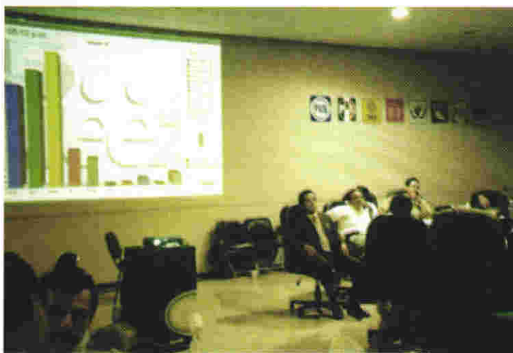
Los resultados del sufragio fueron proyectados en tiempo real en dos pantallas gigantes instaladas en el Consejo General

Con ese fin, el operativo del PREP se trazó de manera que los resultados del sufragio fluyeran desde el momento mismo de su recepción y captura en los Consejos Electorales Distritales y Municipales, siendo proyectados en tiempo real y gráficamente en dos pantallas gigantes, una por cada tipo de elección, de modo que los interesados en la jornada electoral pudieran seguir puntualmente el flujo numérico del voto emitido en los 18 distritos y los 57 municipios.