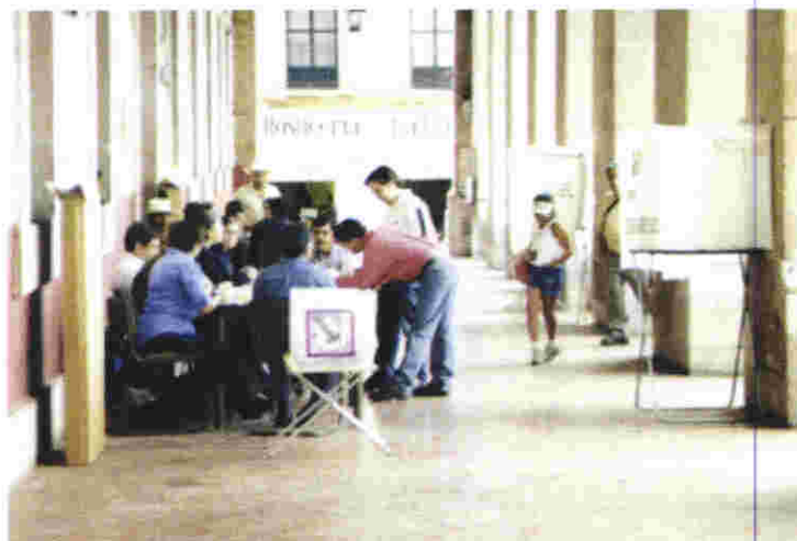
Los Consejos Distritales aprobaron la instalación de 2,212 casillas, mismas que el día de la elección se instalaron sin incidentes graves

En otros casos, cuando el problema subyacía, se estableció comunicación con el órgano distrital o municipal para solicitarle mayor información o bien para aclarar y conocer en detalle la situación prevaleciente.